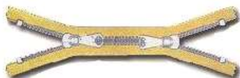
Dois cursores fechado X