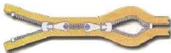
Dois cursores fechado X - O